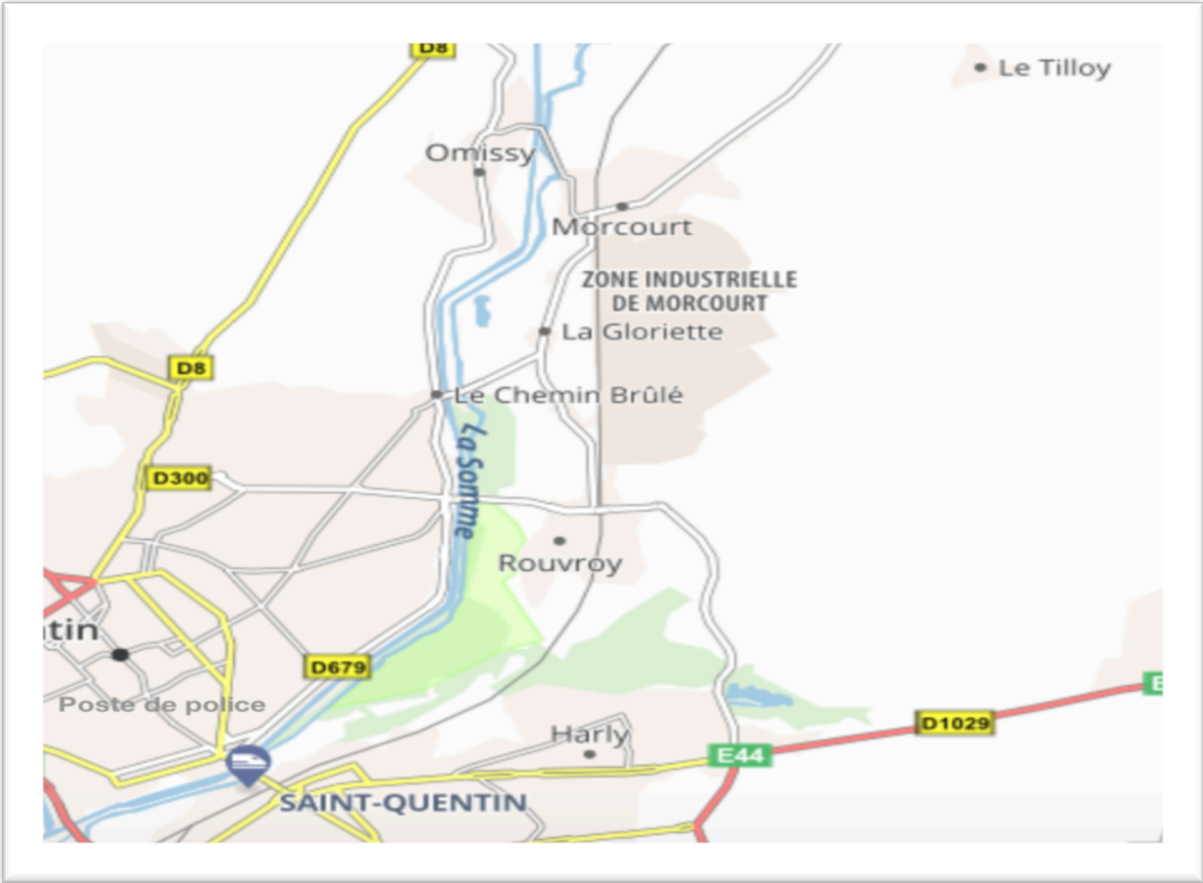
Plan des Secteurs